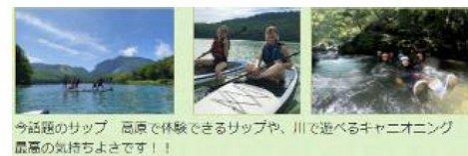
今話題のサップ 高原で体験できるサップや、川で遊ぶキャニオニング 最高の気持ちよさです！！